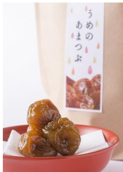
福井梅を使用したお菓子